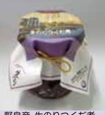
野島産 生のりつくた煮